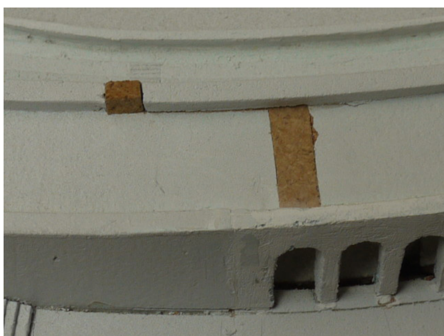
Incrustations de liège