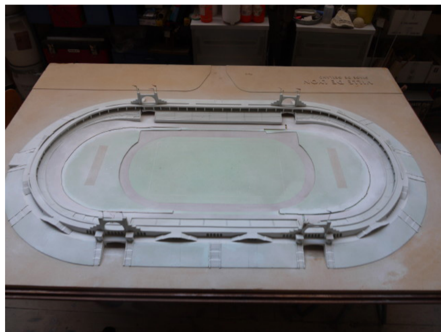
La maquette avant intervention

Au plus tôt, la maquette peut donc être datée du début des années 1950 ou plus probablement au cours des années 1960.